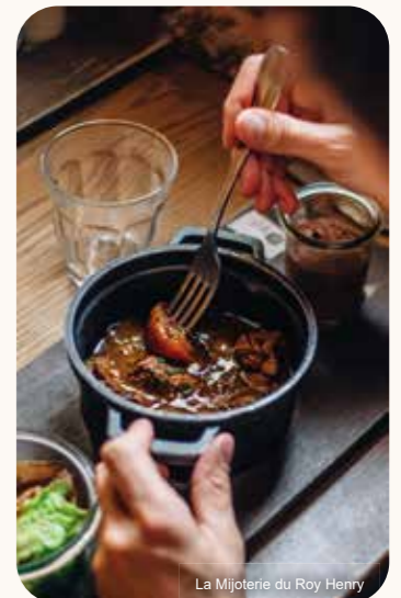
La Mijoterie du Roy Henry

Tarifs sur réservation : 47€ /adulte(4) au lieu de 55€ sur place | 19€50 /enfant(3) au lieu de 21€50 sur place