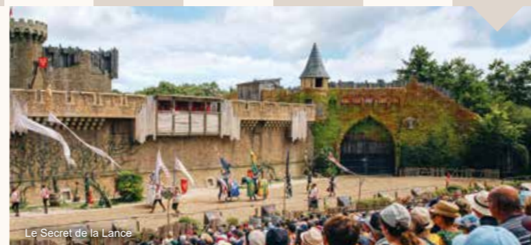
Le Secret de la Lance