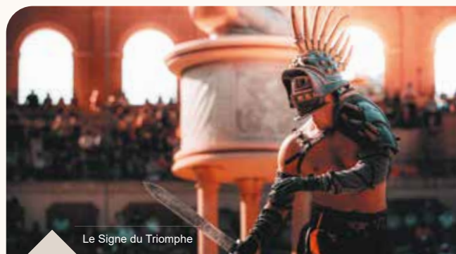
Le Signe du Triomphe

Meilleure Création Européenne BERGAME 2018 AMSTERDAM 2018