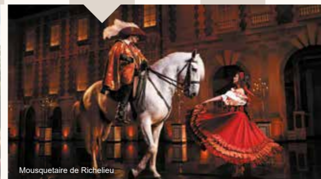
Mousquetaire de Richelieu