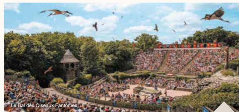
Le Bal des Oiseaux Fantômes