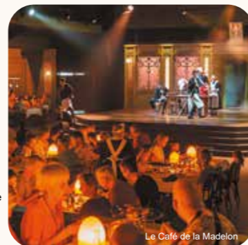
Le Café de la Madelon

Profitez d'un repas convivial accompagné par nos chanteurs entonnant les plus célèbres airs du XVIII ème siècle.