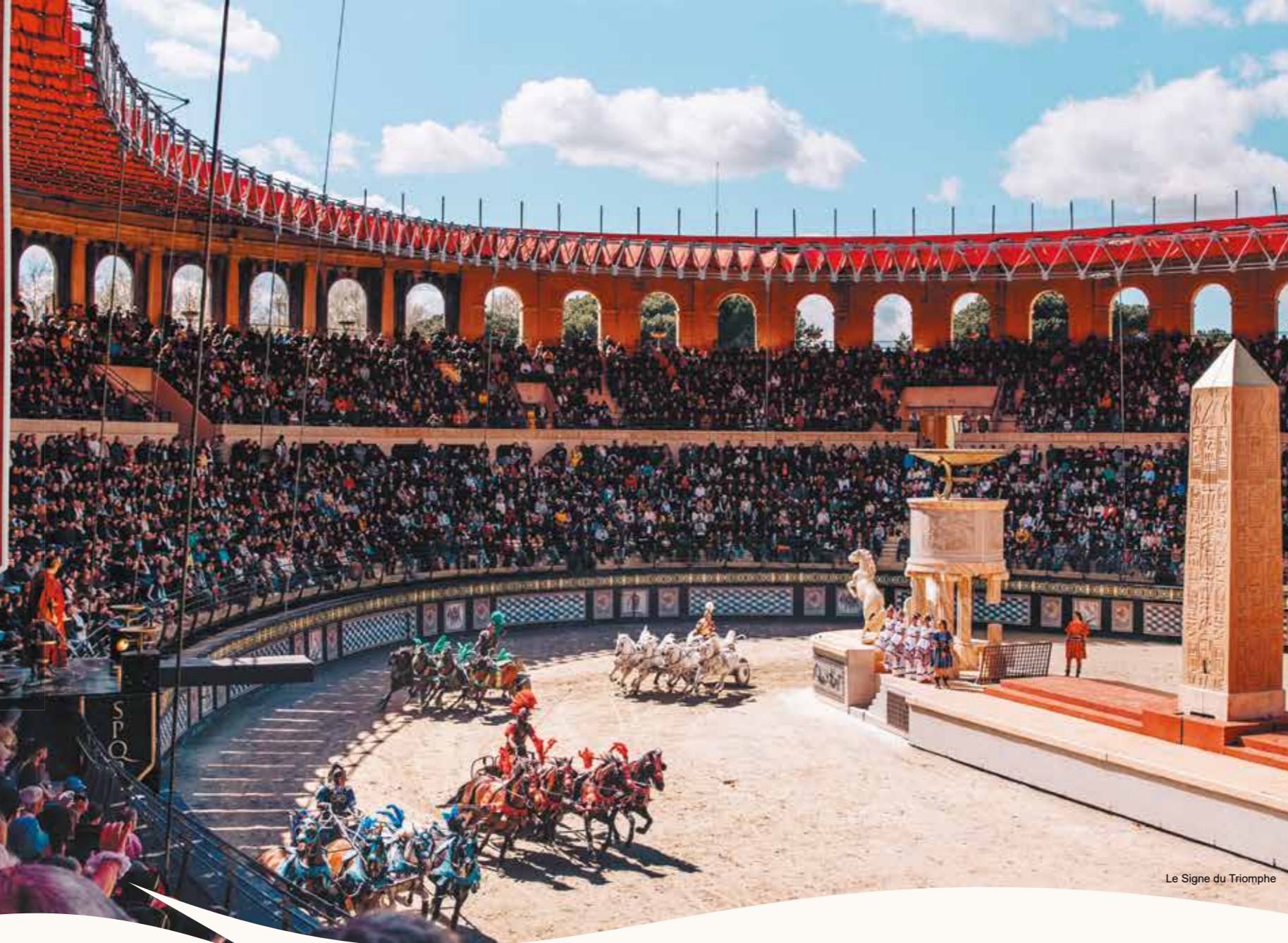
Le Signe du Triomphe