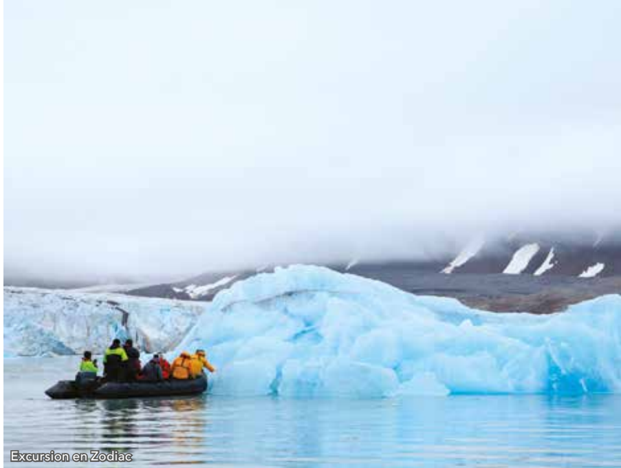
Excursion en Zodiac