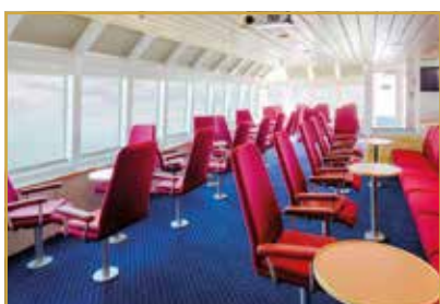
Salon de lecture