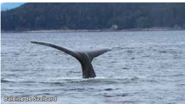
Baleine de Svalbard

Après un vol direct au départ de Paris, nous arriverons à Longyearbyen à la mi-journée. Nous commencerons par une excursion en bus dans la vallée de l'Adventdal et une découverte de la ville. Ensuite, nous embarquerons vers 17 heures et naviguerons dans l'Isfjord. Nous ferons une réunion d'information et naviguerons le long des enclaves minières russes avant de partir en haute mer où nous aurons des chances d'observer des baleines au large de l'île du Prince Charles.