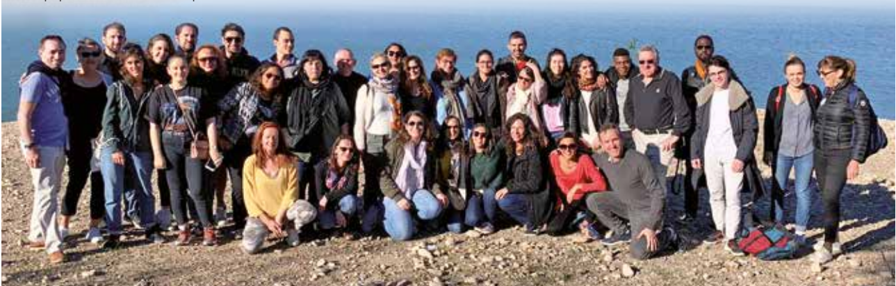
L'équipe Croisières d'exception

Notre vision s'exprime à travers notre signature : s'enrichir de la beauté du monde , c'est revenir chez soi avec un petit « supplément d'âme » qui est l'essence même du voyage selon nous. Cette vision nous est chère pour créer des croisières fondées sur le plaisir de découvrir , d' apprendre et de partager en profitant du plaisir d'être ensemble . Amour du voyage, professionnalisme, bienveillance et esprit de partage sont les valeurs qui nous guident chaque jour pour y parvenir.