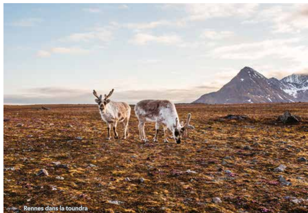
Rennes dans la toundra