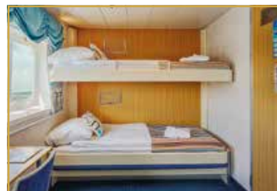
Cabine double, 2 lits superposés, fenêtre

Vous pouvez visualiser ce plan du navire en plus grand sur internet : www.croisieres-exception.fr/oceannova