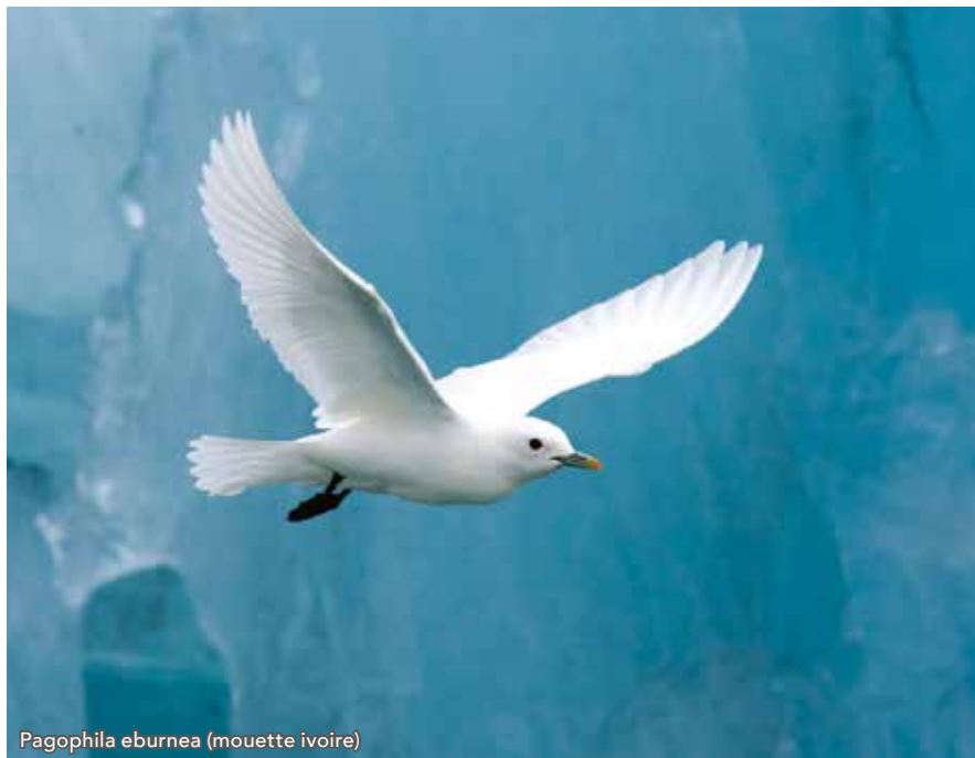
Pagophila eburnea (mouette ivoire)