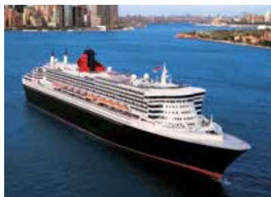
Queen Mary II