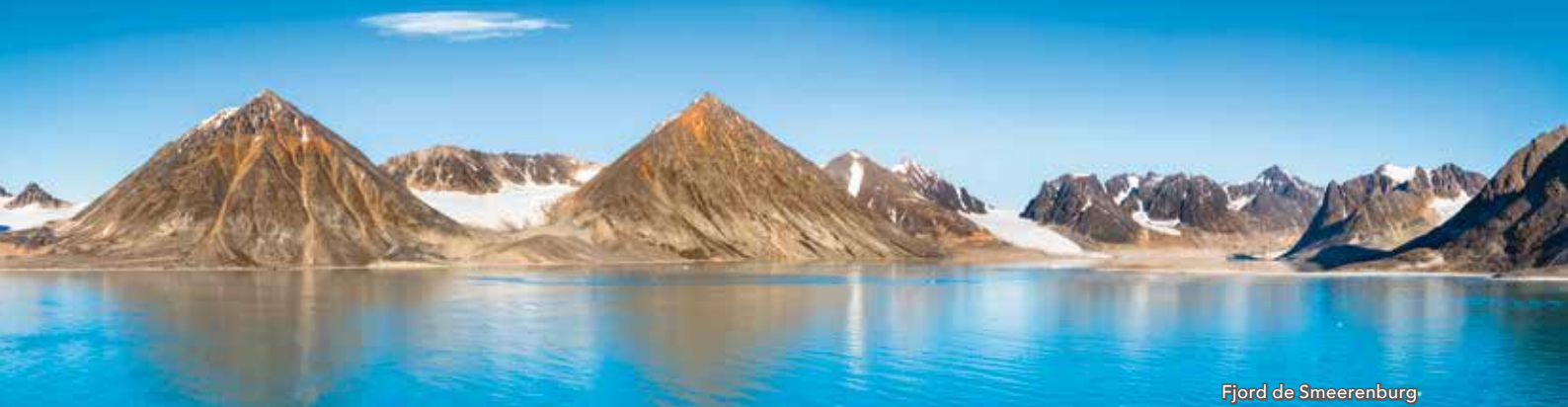
Fjord de Smeerenburg