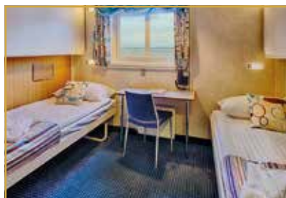
Cabine double, 2 lits bas, fenêtre