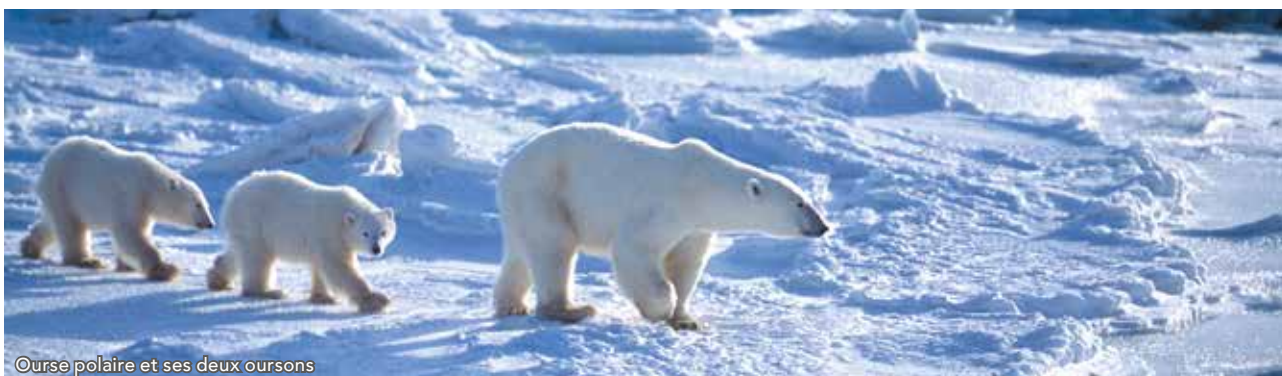
Course polaire et ses deux oursons

Vous aurez un temps libre afin de profiter de la capitale puis viendra l'heure de l'embarquement dans un vol direct vers Paris ou nous arriverons en fin de journée.