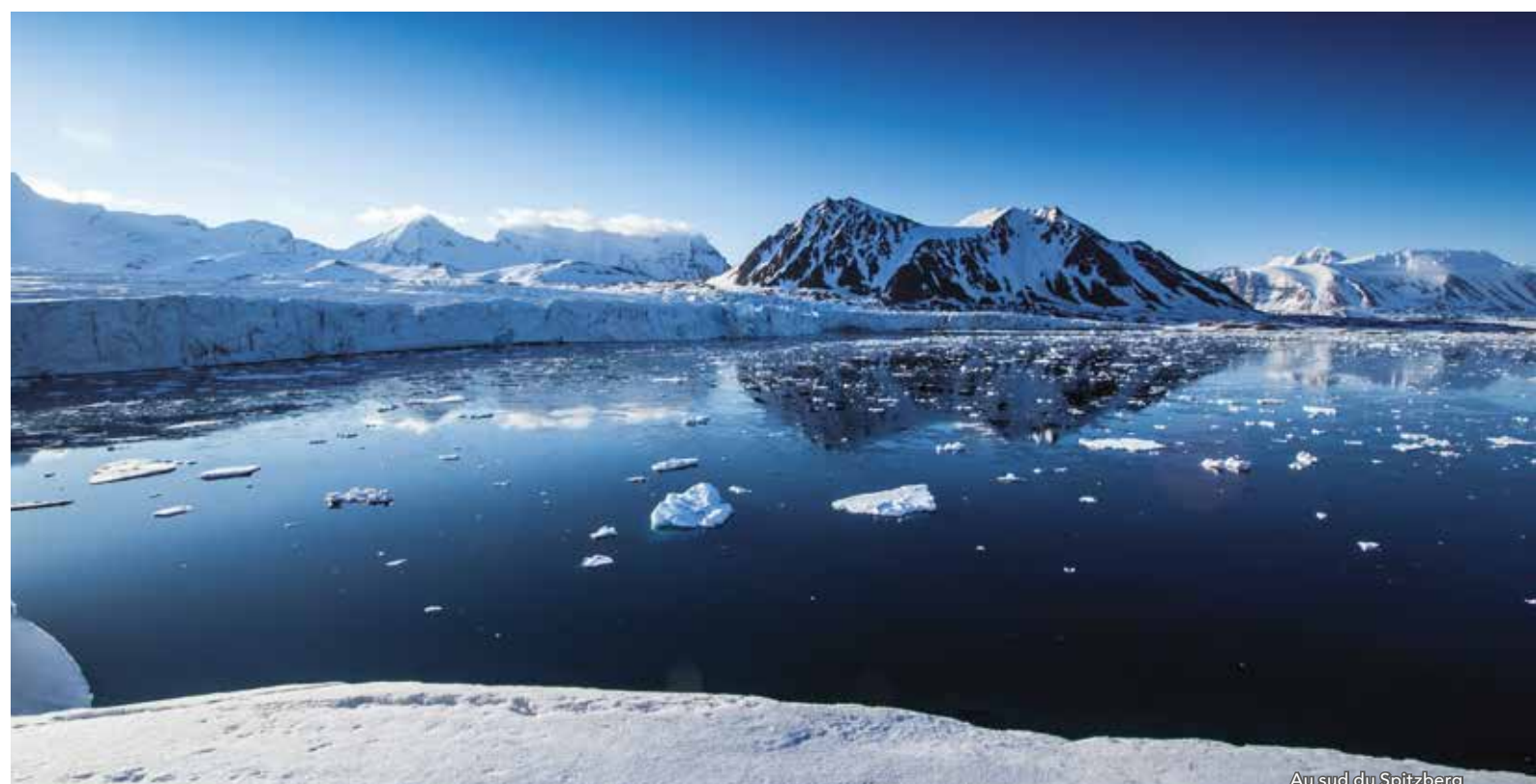
Au sud du Spitzberg